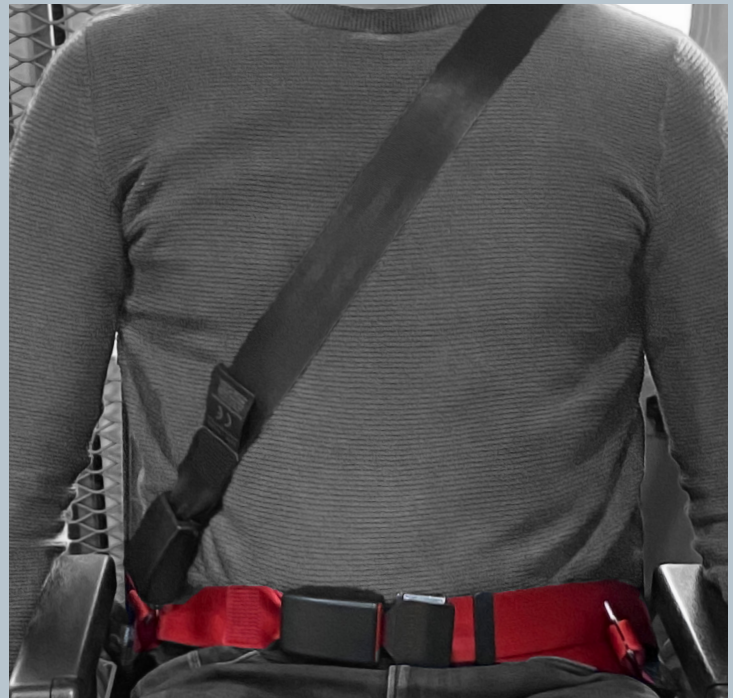
Der Beckengurt (rot) ist fester Bestandteil des Kraftknotensystems. Der Schulterstraggurt (schwarz) ist im KMP/Kfz montiert.

Der vorliegende AMF-Bruns Kraftknotenadapter ist in Anlehnung an DIN 75078-2 / ISO 10542 getestet. Der Rollstuhltest nach ISO 7176-19 obliegt dem Rollstuhlhersteller.