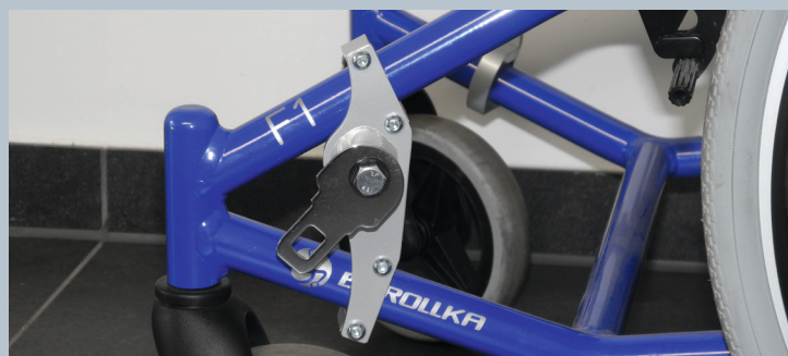
Zwei vordere Kraftknotensysteme mit jeweils einer Schwerlastöse für Spannretractor oder Statikgurt.