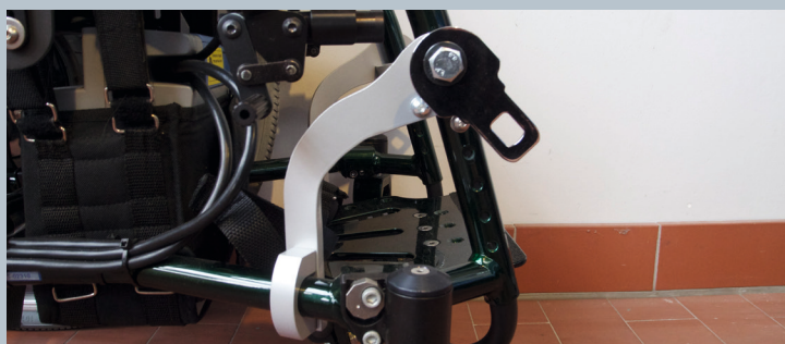
Zwei vordere Kraftknotensysteme mit jeweils einer Schwerlastöse für Spannretractor oder Statigurt.