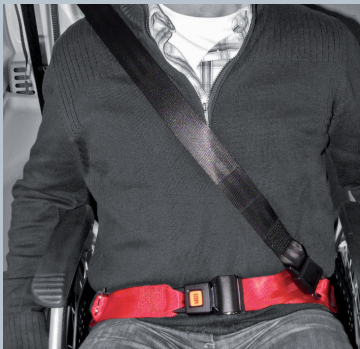
Der Beckengurt (rot) ist fester Bestandteil des Kraftknotens. Der Schulterstraggurt (schwarz) ist im KMP/Kfz montiert.

Der vorliegende AMF-Bruns Kraftknotenadapter ist in Anlehnung an DIN 75078-2 / ISO 10542 getestet. Der Rollstuhltest nach ISO 7176-19 obliegt dem Rollstuhlhersteller.