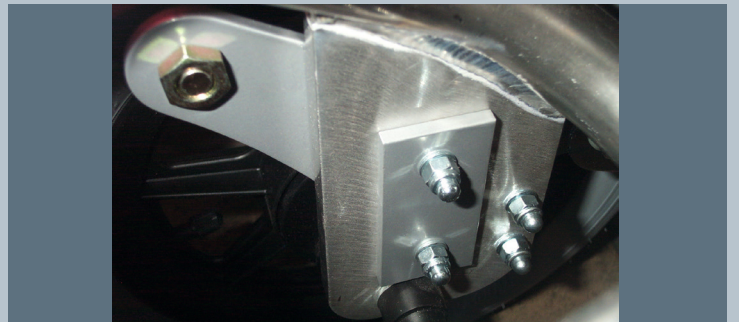
Zwei vordere Kraftknotensysteme mit jeweils einer Schwerlastöse für Spannretractor oder Statikgurt.