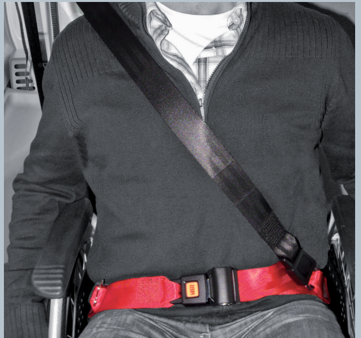
Der Beckengurt (rot) ist fester Bestandteil des Kraftknotens. Der Schulterstraggurt (schwarz) ist im KMP/Kfz montiert.

Der vorliegende AMF-Bruns Kraftknotenadapter ist in Anlehnung an DIN 75078-2 / ISO 10542 getestet. Der Rollstuhltest nach ISO 7176-19 obliegt dem Rollstuhlhersteller.